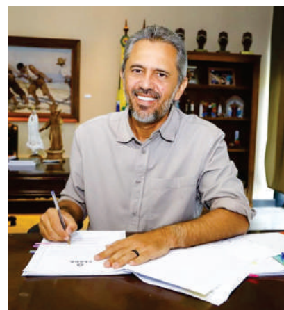
Elmano de Freitas, Governador do Ceará

IDT para realizar o cadastro, portando RG e CPF, para receber o cartão. Além disso, para possuir o Vai Vem Trabalhador o interessado deve ser maior de 18 anos e não possuir emprego formal.