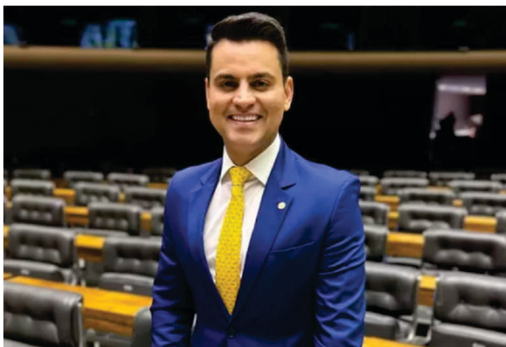
Deputado Federal Yury do Paredão

Nomeado vice-líder do bloco de que faz parte na Câmara de Deputados e relator do Orçamento Geral da União de 2025 para as áreas de infraestrutura, transportes, portos e aeroportos e minas e energia, o deputado federal Yury do