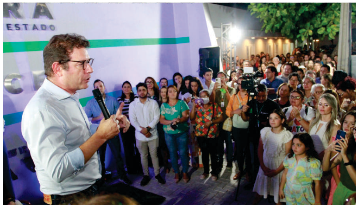
Deputado Renato Roseno, presidente da Comissão de Direitos Humanos e Cidadania

A Assembleia Legislativa do Estado do Ceará inaugurou, nesta sexta-feira (05/07), às 17h, dois serviços focados em direitos humanos e inclusão no município do Crato, região do Cariri. Esta ação é fruto de uma parceria entre a Assembleia, o Governo do Estado e a Prefeitura Municipal do Crato.