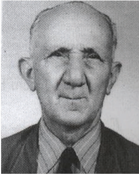
Pedro Felício Cavalcanti

Professor, economista e poeta, Pedro Felício Cavalcanti nasceu em Ipu-CE a 05 de julho de 1905 e faleceu em Crato a 27 de agosto de 1991.