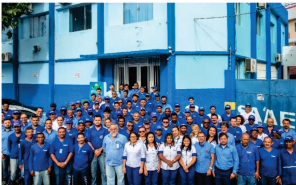
Comemoração dos 57 anos da SAAEC