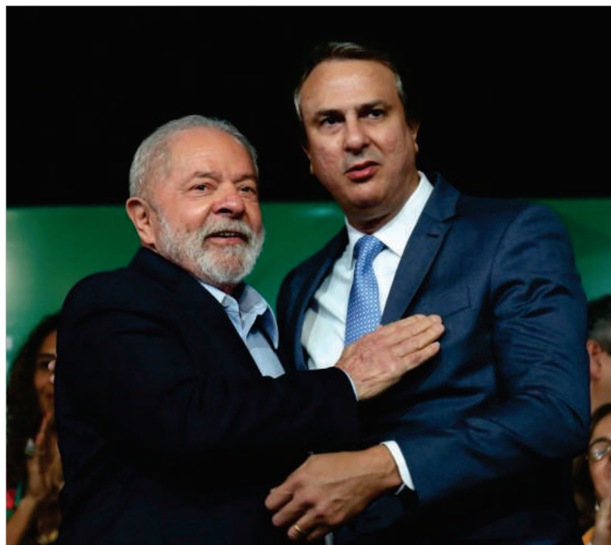
Lula e Camilo Santana